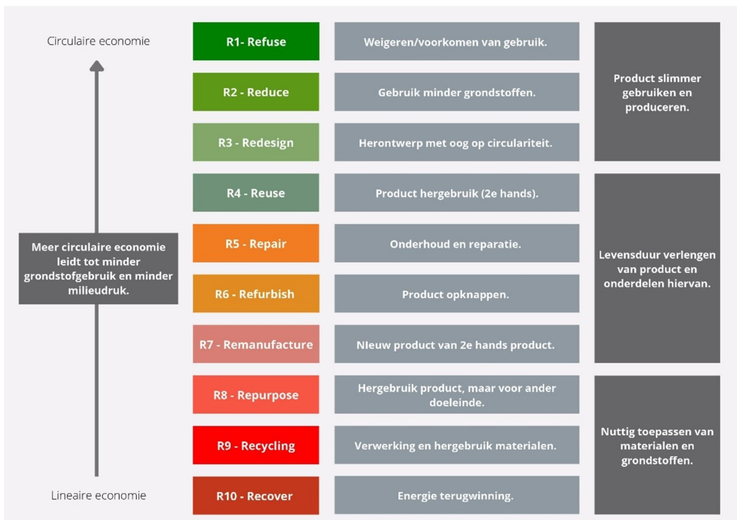
Figuur 1. Prioriteitsvolgorde circulariteit strategieën