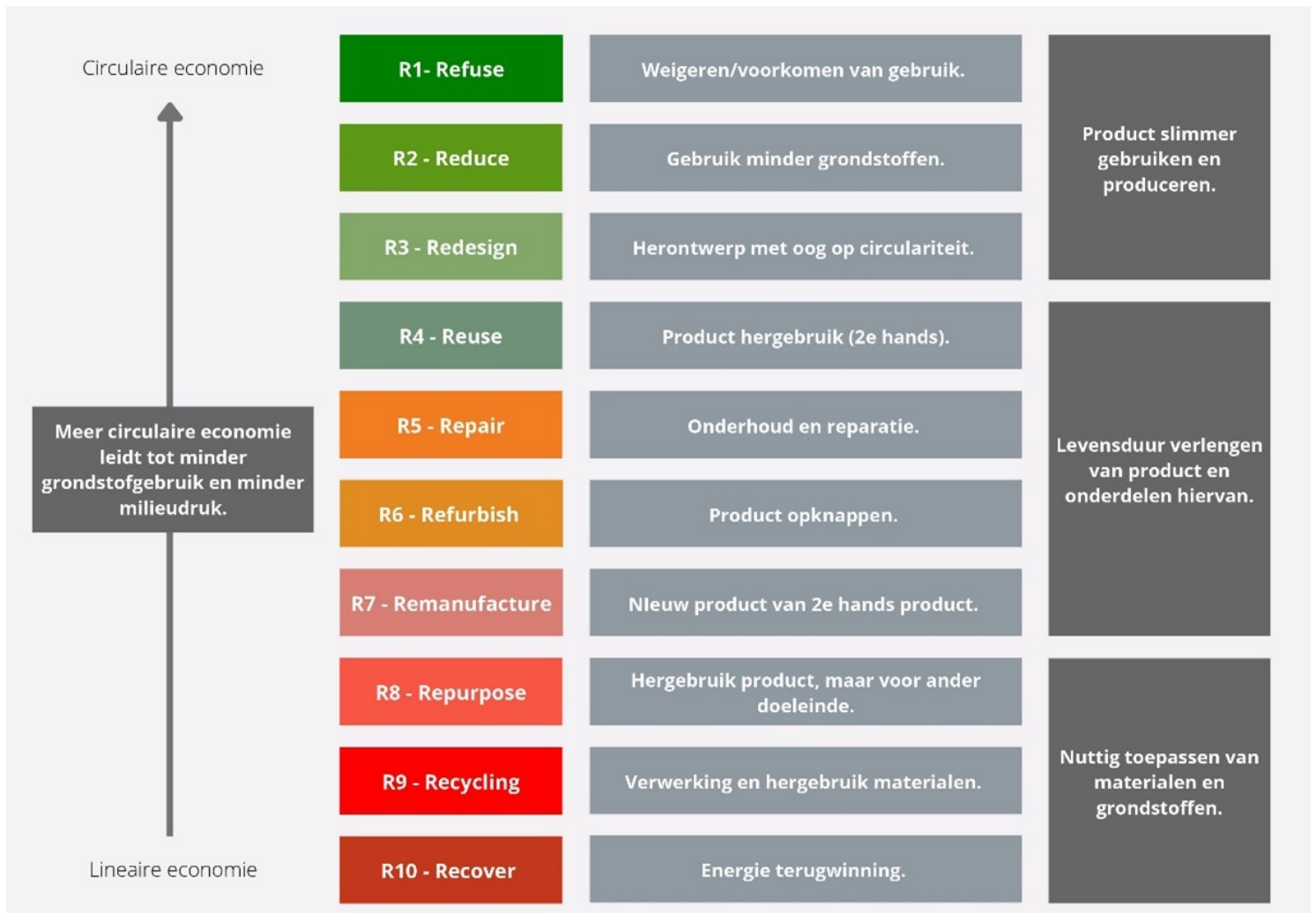
Figuur 1. Prioriteitsvolgorde circulariteit strategieën